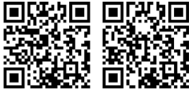
附件 1 网络连线权重稳定性分析 附件 2 中心性指标的稳定性分析